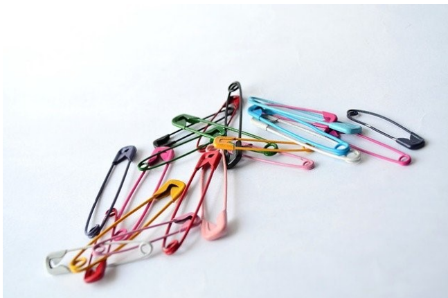
Kuvio 2: Hakaneulaketju on yhtä vahva kuin sen heikoin lenkki.

Kerran kirjoitettu ei kuitenkaan tarkoita, että dokumentti kestää aikaa ja olisi vailla päivitystarvetta. Toimintaympäristön muuttuessa myös Tanssiurheiluliiton on muututtava, ja toimintaohjeiden päivitys ajan tarpeiden mukaisiksi on vain yksi osa vastuullisuustyötä. Toimintaohjeet on jalkautettava päivittäistyöhön ja -toimintaan, kaikilla liiton toiminnan eri tasoilla.