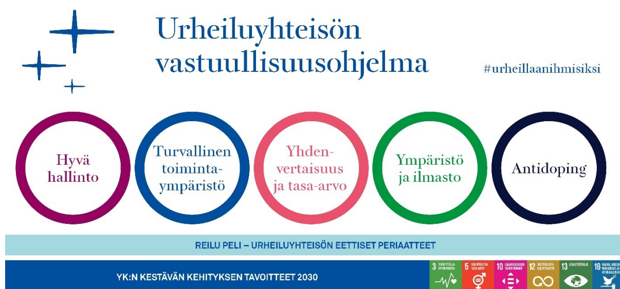
Kuvio 1: Urheiluyhteisön vastuullisuusohjelma 2020-2024 (Suomen Olympiakomitea ry 2020a)

Suomen Tanssiurheiluliitto on mukana koko urheiluyhteisön yhteisessä vastuullisuustyössä. Tämä vastuullisuusohjelma pohjaa Suomen Olympiakomitean yhteistyössä kaikkien lajiliittojen kanssa laatiman Urheiluyhteisön vastuullisuusohjelman (2020a) periaatteisiin, kuitenkin tuoden lajispesifejä lisäyksiä ohjelman sisältöön.