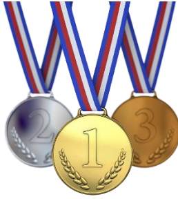
Kuvio 7: Mitalit