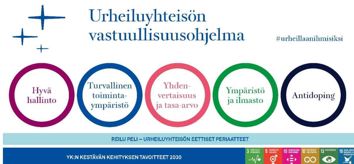
Kuvio 1: Urheiluyhteisön vastuullisuusohjelma 2020-2024 (Suomen Olympiakomitea ry 2020a)

Suomen Tanssiurheiluliitto on mukana koko urheiluyhteisön yhteisessä vastuullisuustyössä. Tämä vastuullisuusohjelma pohjaa Suomen Olympiakomitean yhteistyössä kaikkien lajiliittojen kanssa laatiman Urheiluyhteisön vastuullisuusohjelman (2020a) periaatteisiin, kuitenkin tuoden lajispesifejä lisäyksiä ohjelman sisältöön.