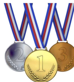
Kuvio 7: Mitalit

Urheilemme puhtaasti käyttämättä kiellettyjä aineita ja menetelmiä.