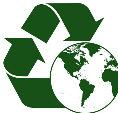
Kuvio 6: Ympäristö ja ilmasto

Tunnistamme ja vähennämme tanssiurheilun ympäristövaikutuksia ja teemme osamme ilmastonmuutoksen hillinnässä. Näytämme esimerkkiä ympäristön huomioimisessa. Haluamme pelata reilusti myös tulevia sukupolvia kohtaan.