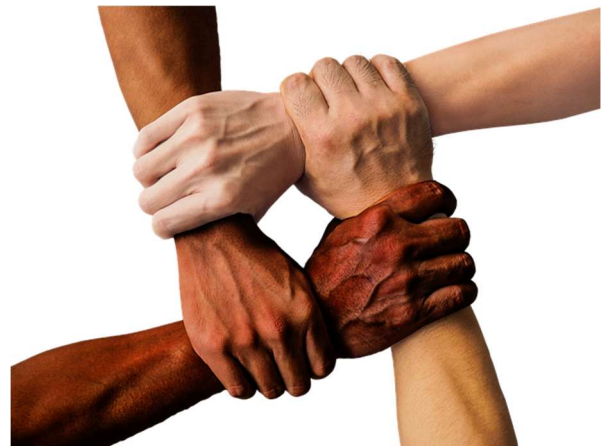
Kuvio 5: Yhdenvertaisuus ja tasa-arvo

Kaikki kokevat itsensä tervetulleeksi mukaan urheilun pariin riippumatta mm. sukupuolesta, etnisestä taustasta, vammasta, seksuaalisesta suuntautumisesta tai taloudellisesta tilanteesta. Edistämme aktiivisesti ja konkreettisesti yhdenvertaisia mahdollisuuksia osallistua.