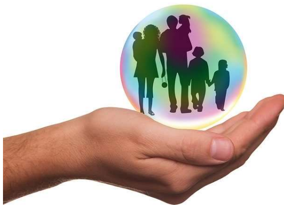
Kuvio 4: Turvallinen toimintaympäristö kaikille lajiperheen sisällä toimiville

Varmistamme, että tanssiurheilu ja -liikunta tuottaa kaikille positiivisia kokemuksia. Pidämme lapset, nuoret ja aikuiset turvassa kiusaamiselta, häirinnältä ja muulta epäasialliselta käytökseltä. Varmistamme, että toimintamme ja olosuhteet ovat turvallisia. Urheilun toimintaympäristömme on päihteetön.