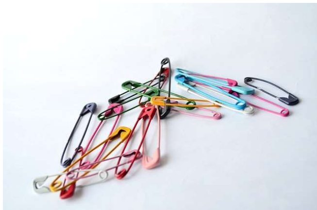
Kuvio 2: Hakaneulaketju on yhtä vahva kuin sen heikoin lenkki.

Vastuullisuus on yksi Tanssiurheiluliiton keskeisistä arvoista. Vastuullisuusohjelmassa kuvaamme myös sitä, kuinka varmistamme eettisen ja vastuullisen toiminnan kaikissa Tanssiurheiluliiton ja sen henkilöstön sekä hallituksen määräysvaltaan kuuluvissa päätöksissä. Vastuullisella toiminnalla tarkoitetaan yhteiskunta-, ympäristö- ja henkilöstövastuun lisäksi sosiaalista ja taloudellista vastuuta suhteessa kaikkiin Tanssiurheiluliiton sidosryhmiin sekä ympäröivään yhteiskuntaan.